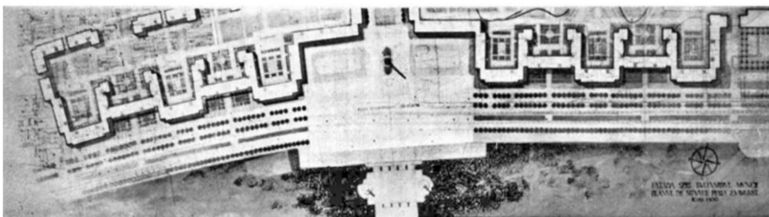
Imaginea 1. Proiectul din 1955 al ansamblului de pe Bulevardul Muncii ( Arhitectura RPR , nr. 7/1955)